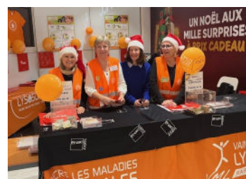
Une (toute petite) partie de l'équipe du stand Parly 2

Sur ce même registre, nous remercions tout aussi chaleureusement la toujours très dynamique équipe de bénévoles de Valence (26) qui, sur son stand d'emballage cadeaux, également pour les clients de l'enseigne FNAC local, a pour sa part réussi à collecter plus de 8 000 euros.